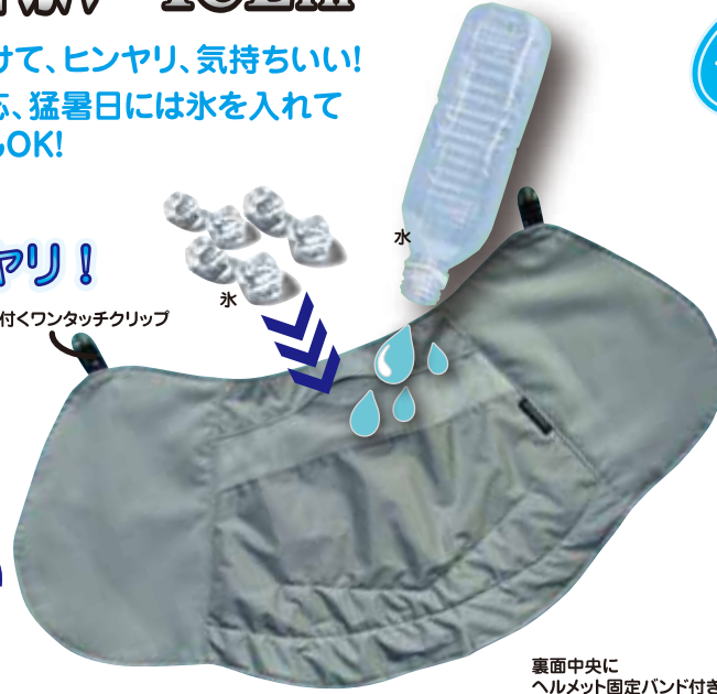
裏面中央にヘルメット固定バンド付き