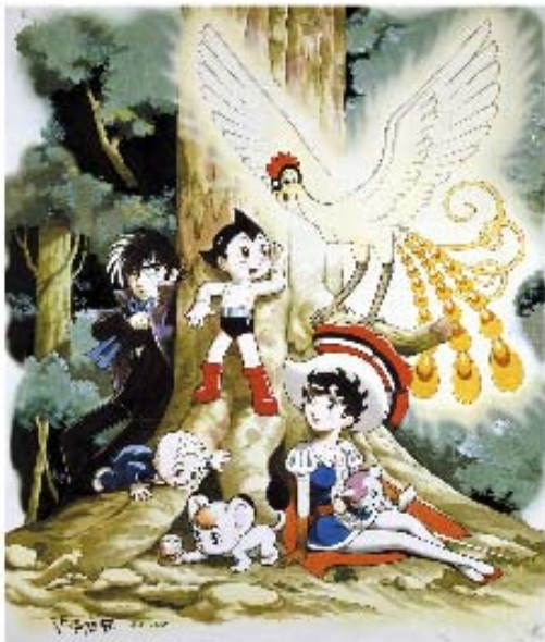
手塚治虫キャラクターの集合絵 版画

手塚治虫作品原画を600 x 600 mm、厚さ1.5 mmのアルミに複製したデジタル版画