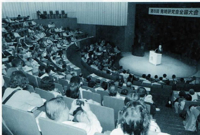
市民発明家の熱気に溢れる会場