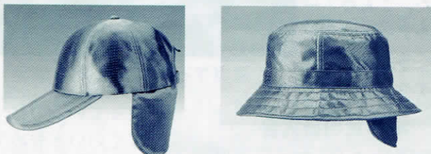
ネット通信販売している クールビット・チタンキャップとハット

それから数年後、「おとうさん、この帽子、ネットでもう3回も同じ人が買いに来たよ、神奈川県でテニスクラブの人が次々と欲しがるので、友達分を頼まれるのだから」家内がニコニコ顔で話しかけます。